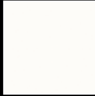
Weiß U002 White U002