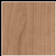
Kirschbaum Romana Cherry tree Romana