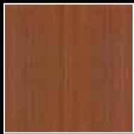
Nussbaum Aida tabak Nut tree Aida tabak