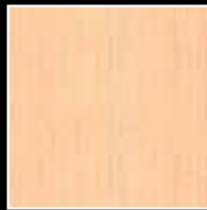
381 Douglas Chiaro (hell) 381 Douglas Chiaro (light)