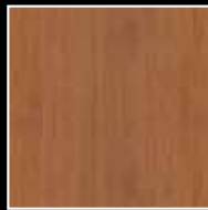
389 Douglas (dunkel) 389 Douglas (dark)

(Die gezeigten Oberflächenmuster können aus reproduktionstechnischen Gründen in ihrer Farberscheinung vom Original abweichen!) (The surfaces shown may differ in color from the original!)